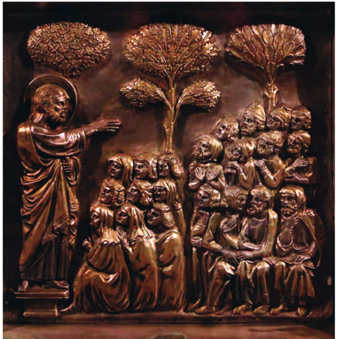
Andrea di Jacopo di Ognabene, San Giacomo Apostolo predica alla folla (1316), Altare d'argento di San Jacopo, Cattedrale di San Zeno (Pistoia)