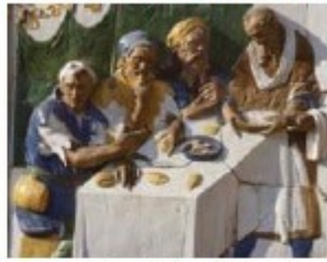
"Dai da mangiare agli affamati"

«Chi ha due tuniche, ne dia e chi non ne ha, e chi ha da mangiare, faccia altrettanto» (Lc 3,10-18)