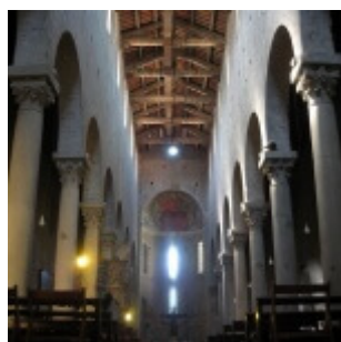
Pieve di S.Andrea - Veduta dell'interno