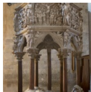
Pieve di S. Andrea - Pulpito di Giovanni Pisano (1301)