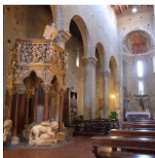
Pieve di S. Andrea - Veduta della navata con il Pulpito