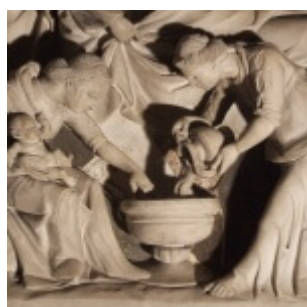
Pieve di S. Andrea - - Pulpito di Giovanni Pisano (1301) -