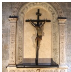
Pieve di S. Andrea - Giovanni Pisano